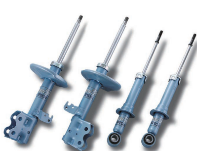
※写真は別の車種のショックアブソーバです。