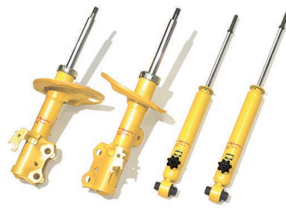
※写真は別の車種のショックアブソーバです。