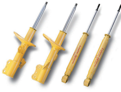
※写真は別の車種のショックアブソーバです。